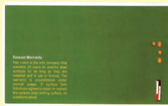
GREEN CHALK BOARD