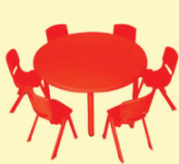
ROUND TABLE CHAIR