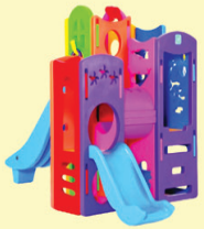
THE OCEAN WORLD