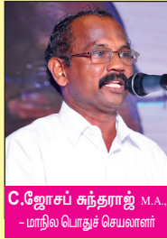
C.ஜோசப் கந்தராஜ் M.A., - மாநிலப் பொதுச் செயலாளர்.