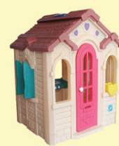
LOVELY GAME ROOM