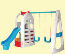
MINI PLAY GROUND