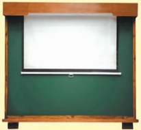
GREEN CERAMIC CHALK BOARD