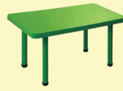
BIG RECTANGLE TABLE

Old No : 361, New No : 635, P.H.Road, Aminjikarai, Chennai - 600 029.