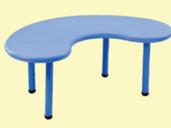
FRONT ROUND TABLE