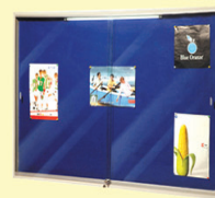
MODULAR SLIDING GLASS DOOR NOTICE BOARD